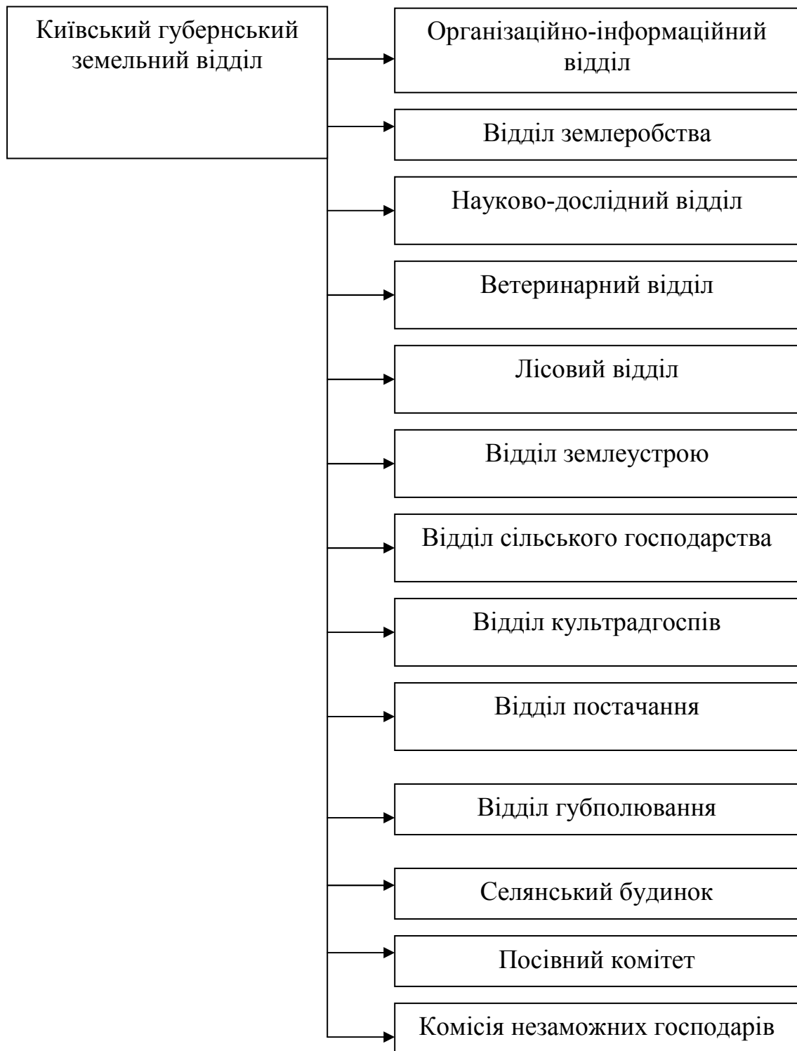
Рис. 2. Організаційна структура відділу хліборобства Київського губернського земельного відділу в 1921 році