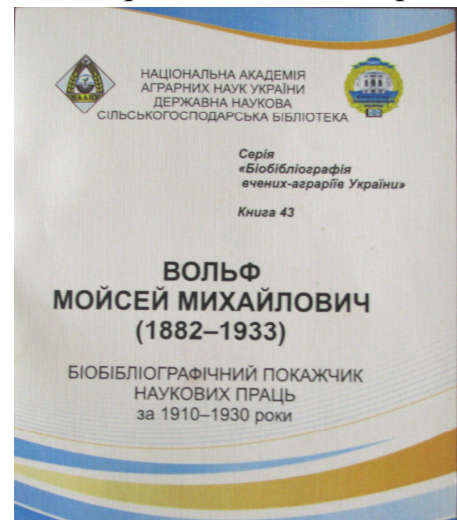
Біобібліографічний покажчик наукових праць М. М. Вольфа за 1910–1930 рр.

Біобібліографічний покажчик є науково-допоміжним виданням, що розраховане на наукових працівників у галузі аграрної, економічної, історичної