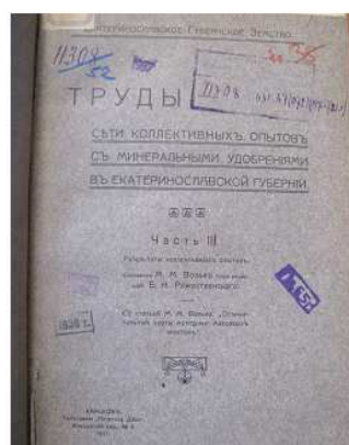
Перші наукові роботи вченого М. М. Вольфа (1910 р.)