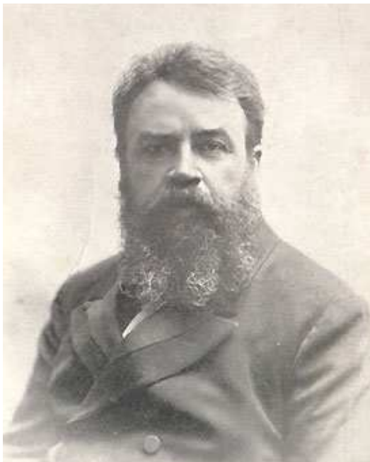
Рис. 1. Юхим Лук'янович Зубашев (1860–1928)

Предметом нашого дослідження став харківський період життя Юхима Лук'яновича Зубашева, а саме, діяльність в Харківському відділенні