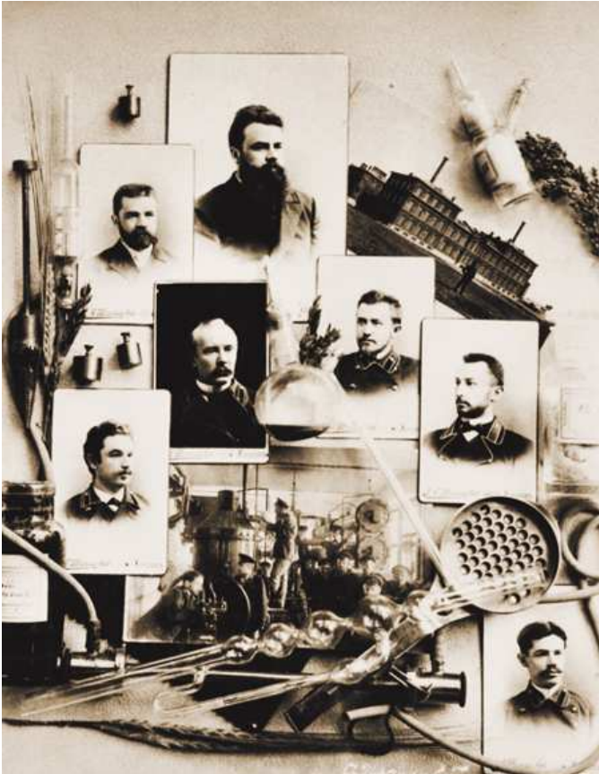
Рис. 4. Професор Ю. Л. Зубашев з випускниками Харківського технологічного інституту, 1894 р.

У грудні 1887 р. він отримує відрядження за кордон з науковими цілями