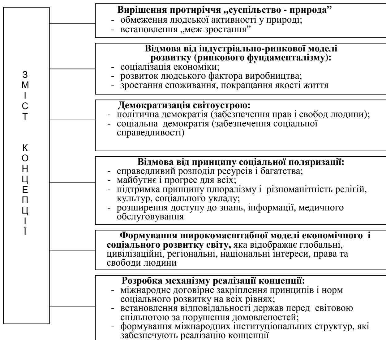
Рис. 1. Концепція сталого соціального розвитку

Головний висновок з цього: ринкова культура формує образ життя людей, який руйнує біологічну основу людини при падінні суспільної моралі [9, С. 290–291].