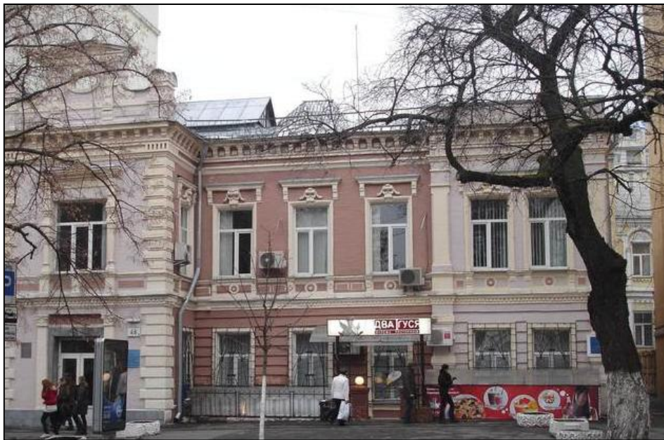
Перша редакція «Вісника сільськогосподарської науки» (м. Київ, вул. Леніна, 46)

зазначалося, що цей періодичний орган присвячується «... науці сільськогосподарській, – тим галузям знання, що студіюють або саме сільське господарство у різних його проявах, або ті фактори природні та суспільні, що створюють складні умови сільського господарства...» [9]. Варто відмітити, що розвиток вітчизняної сільськогосподарської науки завжди був запорукою безупинного поступу сільського господарства – основи продовольчої безпеки країни.