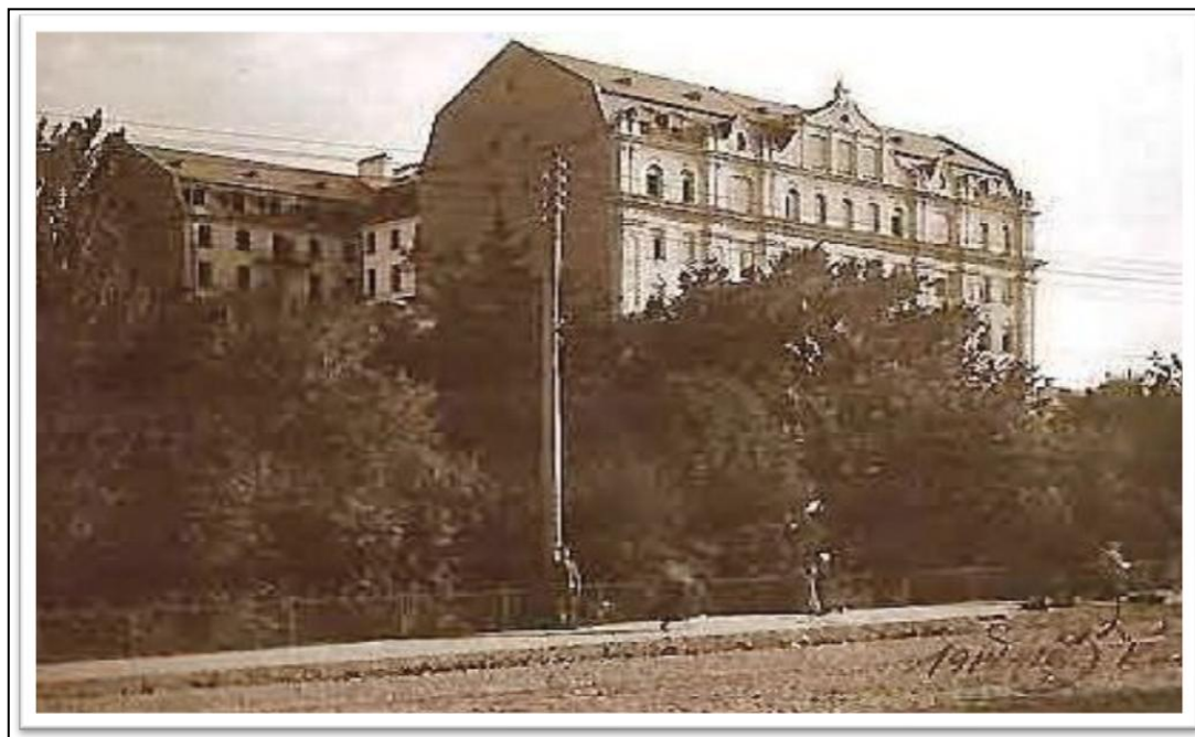
Перша будівля Сільськогосподарського наукового комітету України (м. Київ, вул. Володимирська, 19)

України (СГНКУ), заснований 30 листопада 1918 р. у Києві [1]. Він став знаковим явищем в історії вітчизняного галузевого дослідництва протягом 1918–1927 рр.