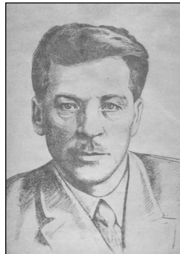
П. П. Постишев

Відмічаючи прорахунки галузевої академії щодо майбутнього в сільському господарстві, радянська система, як альтернативу цій структурі, розпочала організацію колгоспної дослідної справи з метою активізації розвитку аграрної науки.