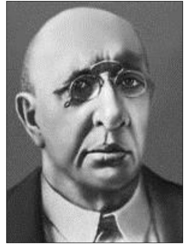
В. Р. Вільямс

Радянський ґрунтознавець-агроном, один із основоположників агрономічного ґрунтознавства, академік Василь Робертович Вільямс теж підтримував появу та розвиток колгоспної дослідної справи, в т. ч. й появу хат-лабораторій. Він наголошував на позитивному впливі соціалістичних умов усупільненої праці, які підвели виробників до узагальнення накопиченого досвіду, синтезу і формування основних законів виробництва. Однак, разом з цим, розумів, що високої продуктивності праці станом на середину 30-х рр. ХХ ст. ще не досягнуто. Він вважав, що хати-лабораторії повинні були працювати й на підтримку стаханівського руху, який тоді набирив обертів [5, С. 152–153].