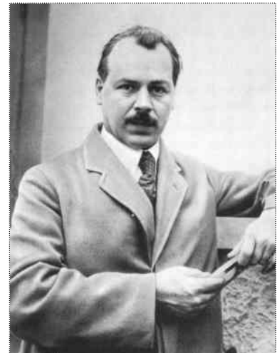
М. І. Вавилов

В розвитку аграрної науки у 30-х роках ХХ століття виокремлюється два періоди, які різнилися за принципами і підходами до становлення вітчизняної сільськогосподарської дослідної справи. Перша половина десятиліття пронизана ідеєю академічності на чолі з академіком М. І. Вавиловим, друга – розвитком дослідництва у колгоспній дослідній справі, ініціатором якої був Т. Д. Лисенко.