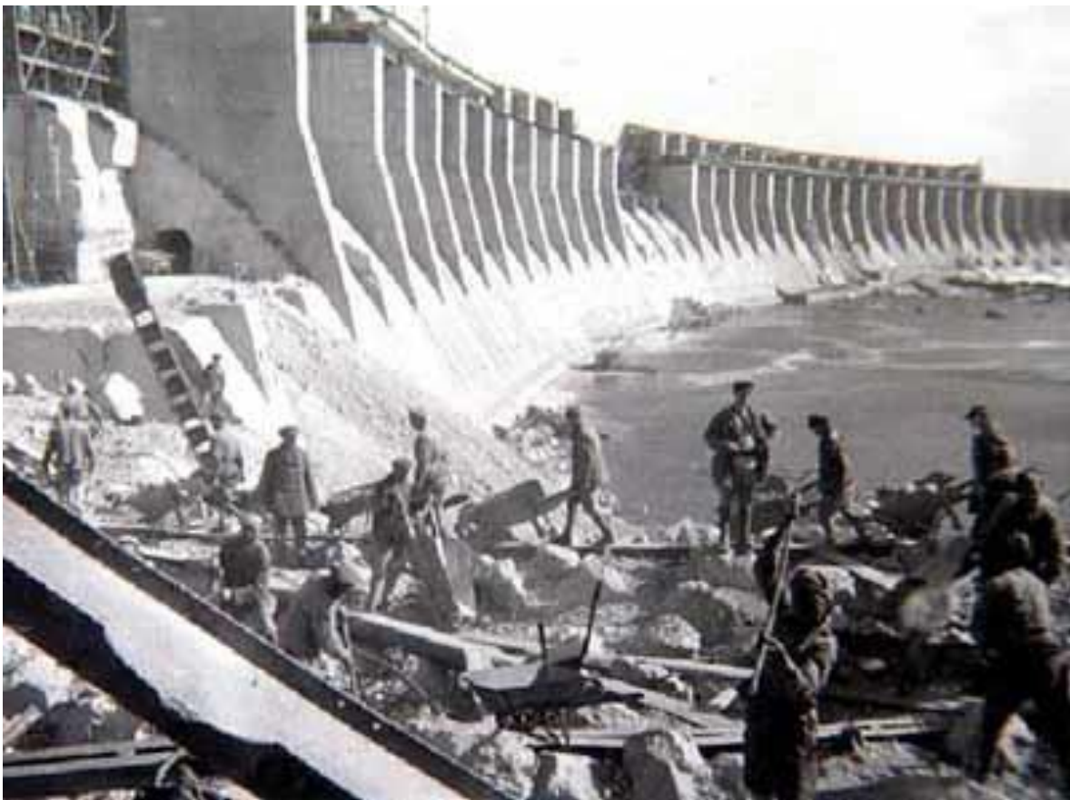
Рис. 2. Будівництво Дніпрогесу, 1930 р.

річках Дніпро, Волхов, Свірь, а також у Середній Азії, на Кавказі, Алтаї [4, с. 128]. З перших років реалізації плану ГОЕЛРО гідроенергетичне будівництво стало одним із головних напрямів розвитку електроенергетики, що було обумовлено наявністю потужного гідроенергетичного потенціалу. Першою ГЕС, побудованою за планом ГОЕЛРО під керівництвом проф. Г.О. Графтіо, стала Волховська ГЕС потужністю 58 МВт із водосховищем місткістю 10,2 км 3 , яка була введена в експлуатацію в 1926 р. Вона забезпечила електропостачання Ленінграда і створила суцільний судноплавний шлях на р. Волхов. Енергія, що мала вироблятися потужною гідроелектростанцією на Волхові, мала бути набагато дешевшою, ніж енергія петербурзьких теплоелектростанцій, які працювали на дорогих донецькому та імпортованому англійському вугіллі. Після встановлення в Росії радянської влади почалися заходи по будівництву Волховської гідроелектростанції. Підготовчі роботи на Волховбуді почалися у 1919 році, а до інтенсивного будівництва приступили у 1921 р.» [5, с. 12].