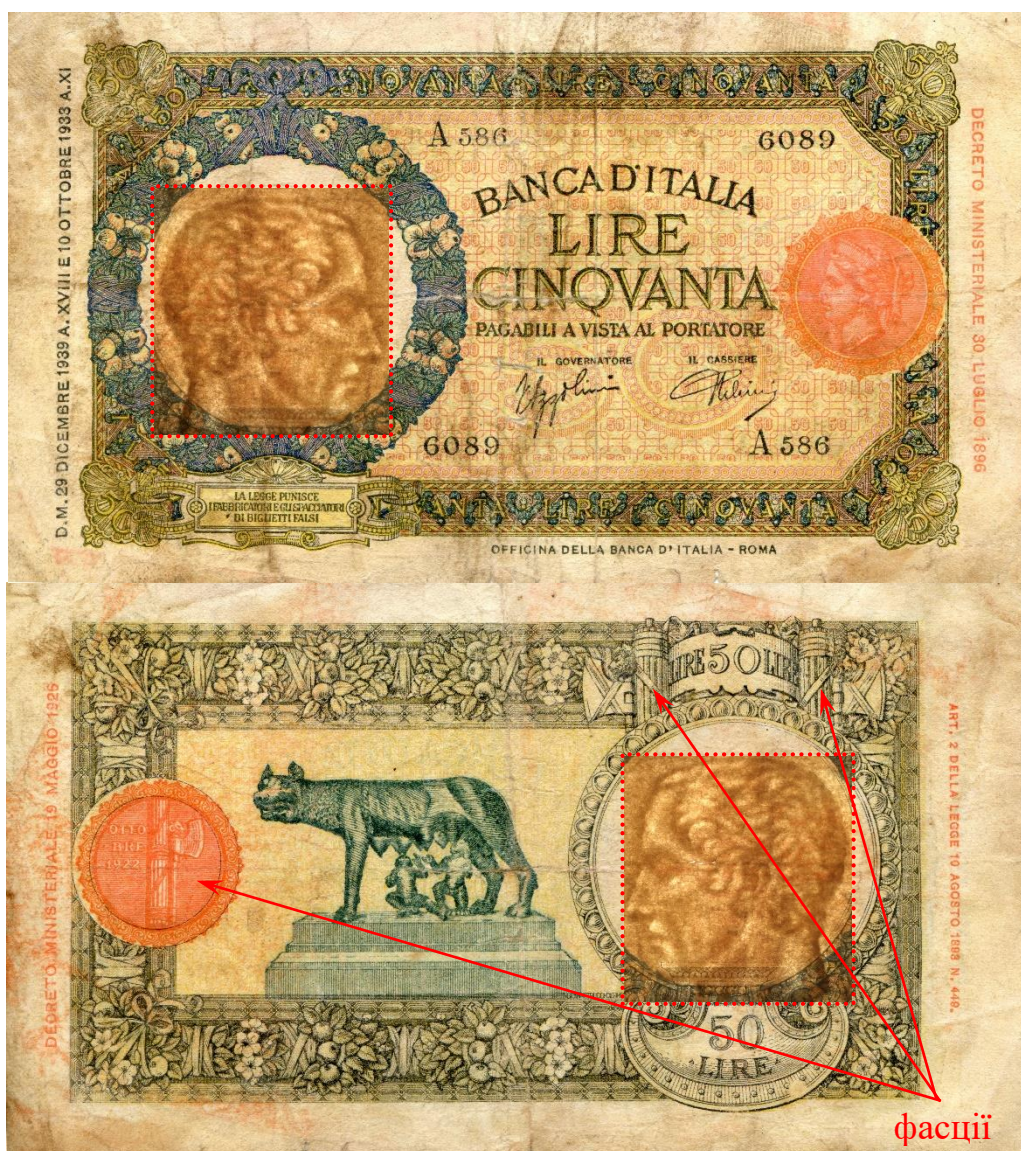
Рисунок 4 – Італійська банкнота із зображеннями фашистської символіки