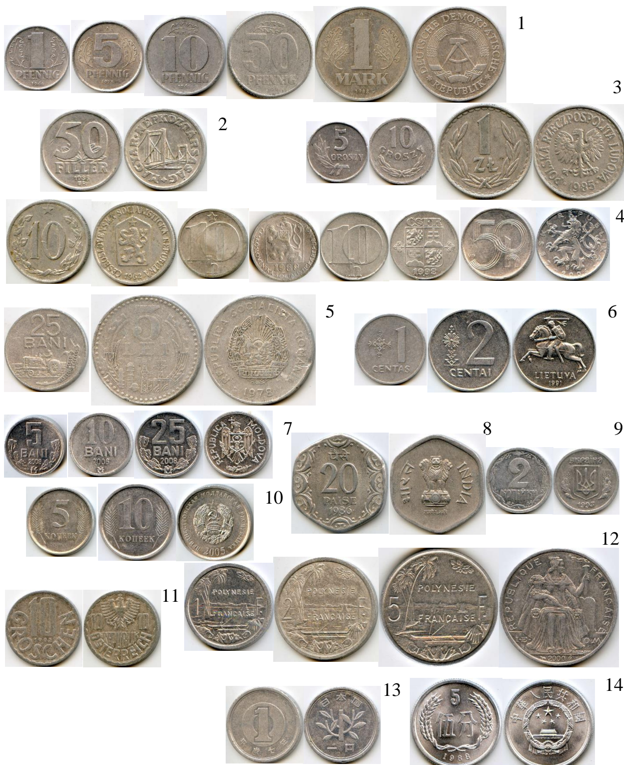
Рисунок 3 – Зразки алюмінієвих монет: 1 – Німецька Демократична Республіка (1958-1982 рр.); 2 – Угорська Народна Республіка (1985 р.); 3 – Польська Народна Республіка (1961-1985 рр.); 4 – Чехословацька Соціалістична Республіка (1962, 1988 рр.), Чеська і Словацька Федеративна Республіка (1992 р.), Чеська Республіка (2006 р.); 5 – Соціалістична Республіка Румунія (1978, 1982 рр.); 6 – Литовська Республіка (1991 р.); 7 – Республіка Молдова (2006, 2008 рр.); 8 – Республіка Індія (1986 р.); 9 – Україна (1993 р.); 10 – Придністровська Молдавська Республіка (2005 р.); 11 – Республіка Австрія (1992 р.); 12 – Французька Полінезія (1989-2004 рр.); 13 – Японська Держава (1995 р.); 14 – Китайська Народна Республіка (1988 р.)