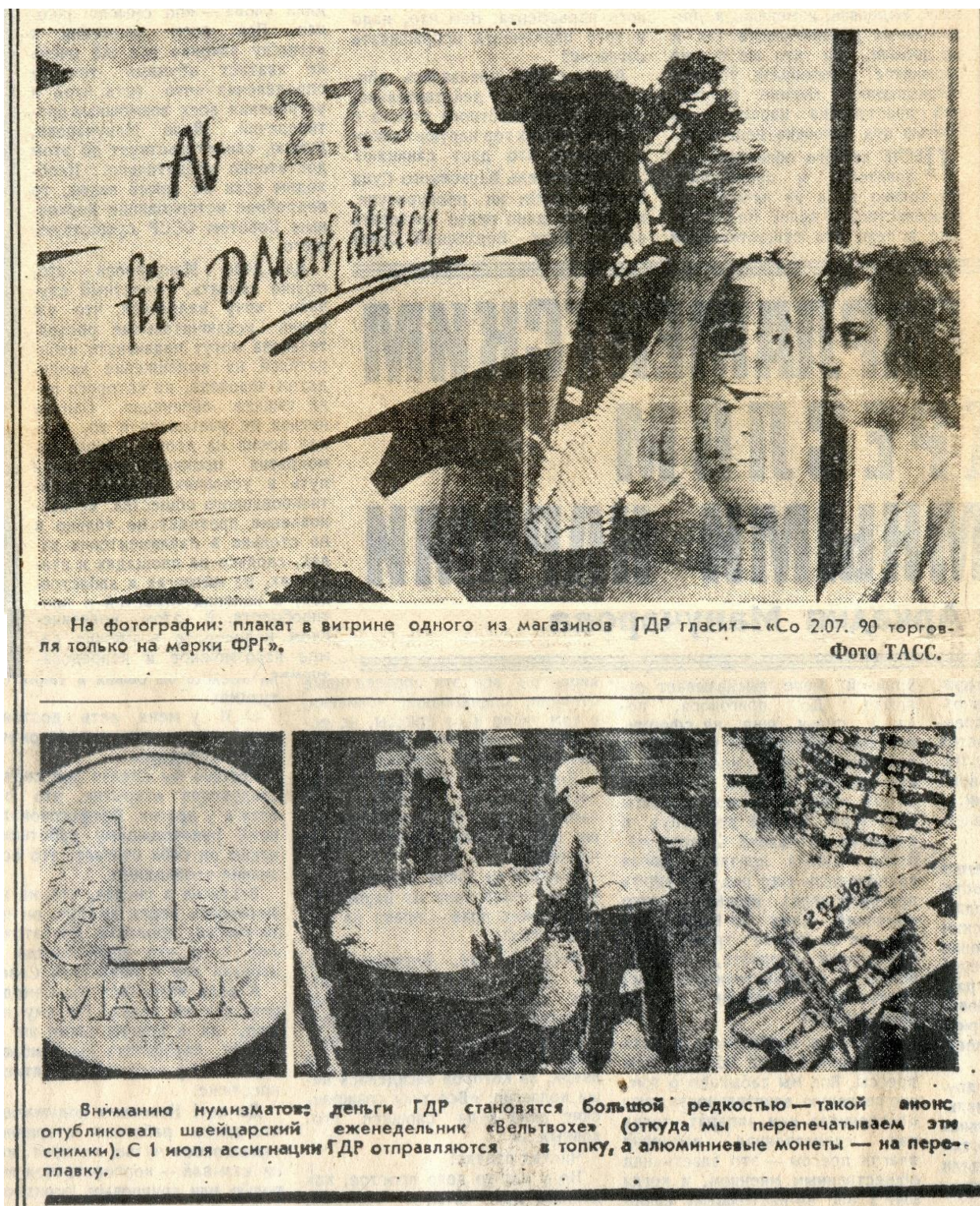
Рисунок 1 – Публікації в газеті «Ізвестія» 1990 р. [10]

Звісно, друковані новинні видання не могли обходити стороною і певні проблемні моменти політичного життя країни, тим більше – буквально у